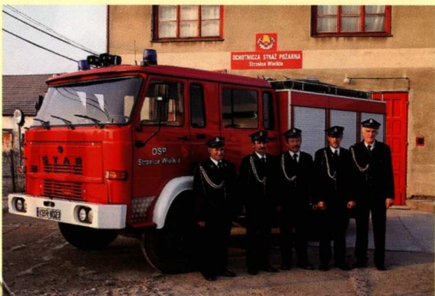
Remiza Ochotniczej Straży Pożarnej