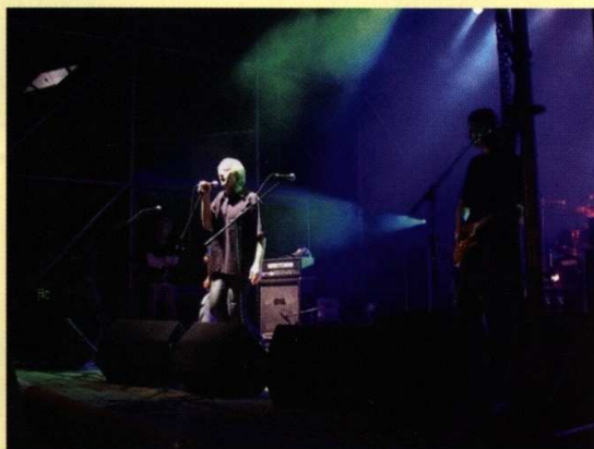
"IRA" - koncert w 2004 r.