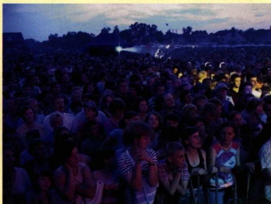
Publiczność bawiąca się podczas koncertu w 2004 r.