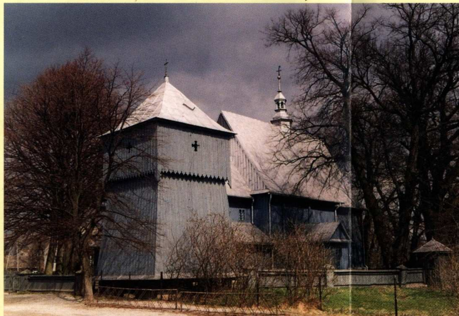
Drewniany kościół p.w. św. Sebastiana z 1785 r.