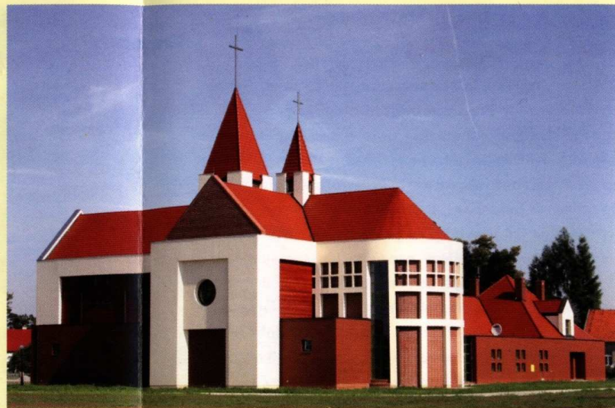
Nowo wybudowane Sanktuarium Matki Bożej Szkaplerznej