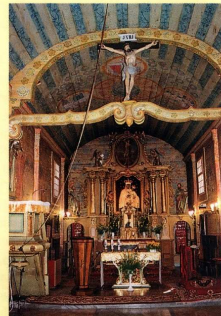
Ołtarz główny w kościele św. Sebastiana